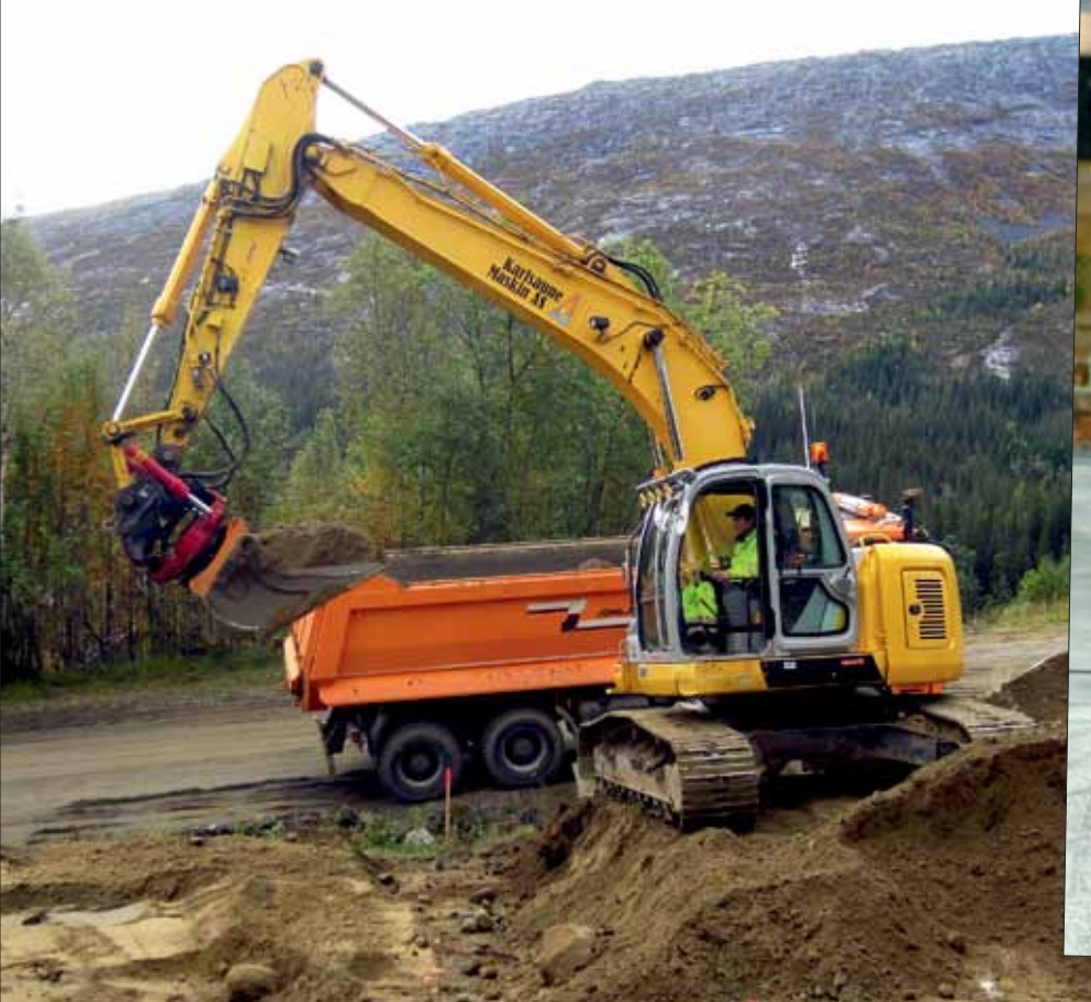
Steffen Karlsauve på jobb i nærheten av Mosjøen i egen gravemaskin.