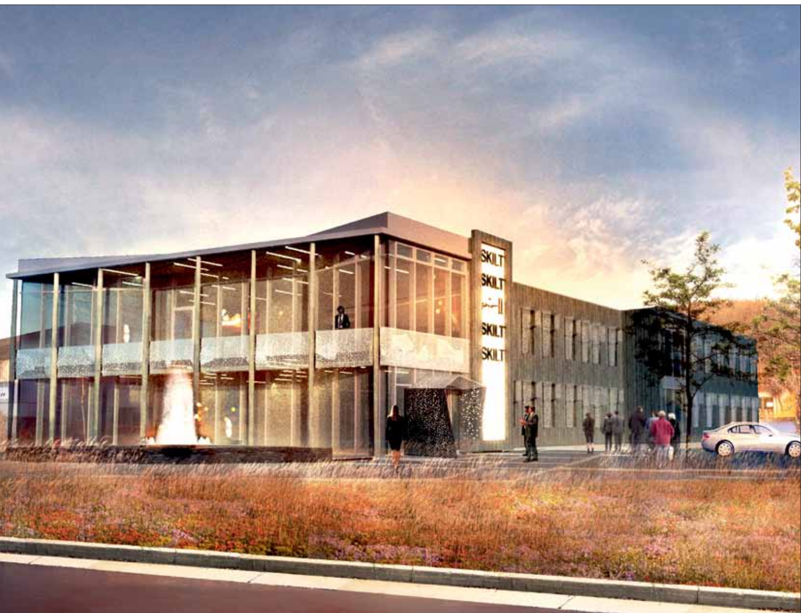
Slik er planen per desember 2013 at «nye» Åfjord Sparebank sin fasade mot Joakim Brevold allé skal se ut. Illustrasjon: Pir II